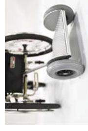
BIGA per telaio fisso