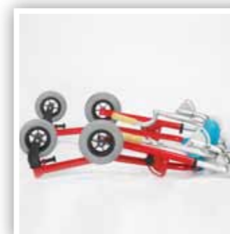
Telaio pieghevole Folding frame