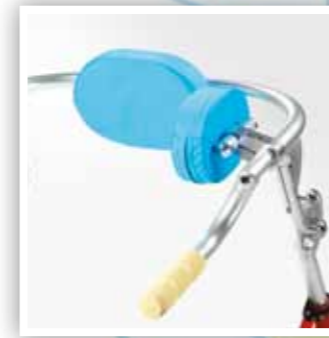
Blocchetto di regolazione supporto anche Hip support adjustable fastening