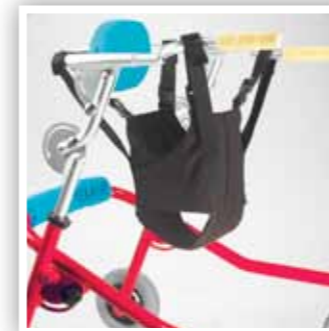
Mutandina di sostegno Sling seat