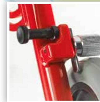
Selettore freno unidirezionale One-way brake