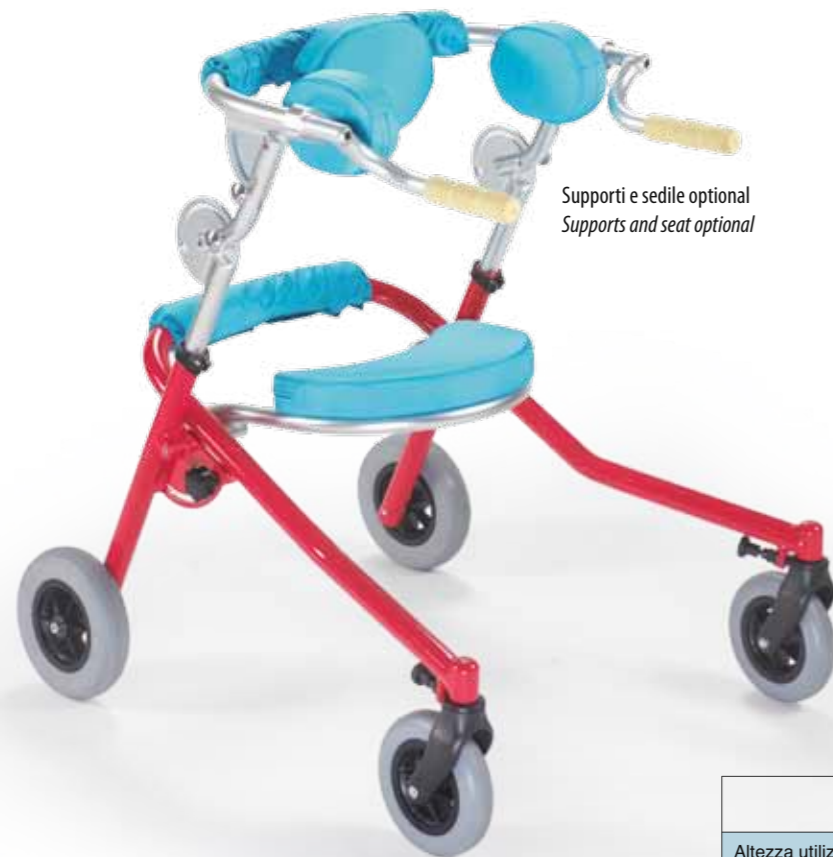
Supporti e sedile optional Supports and seat optional