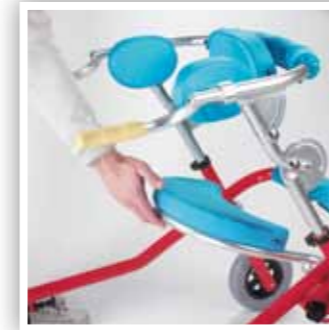
Seggiolino pieghevole (optional) Sostegno anche e bacino regolabili (optional) Folding seat (optional) Adjustable hip and pelvic supports (optional)